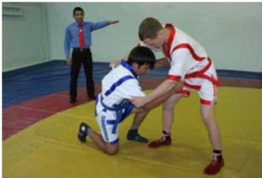
4 – сурет. «Бүк» белгісін көрсету әдісі

Бір ескерту «Бүк» әдісіне тең, Үш «Бүк» бір жамбасқа тең.