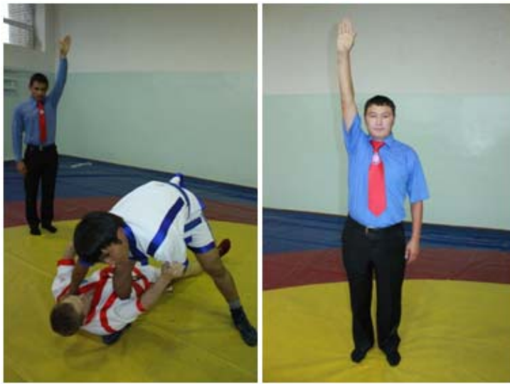
10 – сурет. «Таза жеңіс» белгісін көрсету әдісі

В) "Таза жеңіс" екі жауырынының тиюі әсерінен болған әдіс тәсілі. Оң не сол қолын жоғары көтеріп, алақанын алдыға белгілеп ұстайды; хаттамада «Т-Ж» деп белгіленеді.