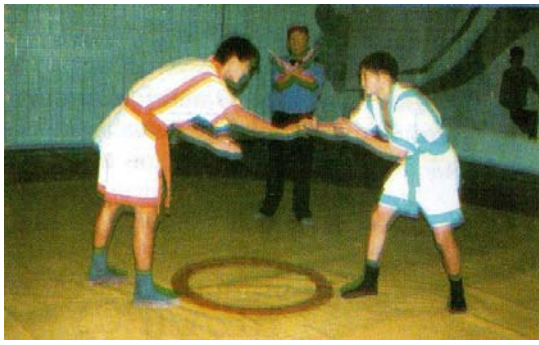
2 – сурет