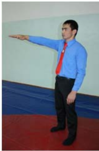
3 – сурет. «Бүк» белгісін көрсету әдісі

А) "Бүк"- жасалынған әдіс балуанның ішіне, қолына, тізесіне тиіп, балуандардың бірінің тізесі кілемге тиюімен аяқталған жағдайда беріледі. Дауыстап "Бүк" деп айтылады, оң не сол қолын йығының деңгейіне көтеріп, алақанын төмен қаратып ұстайды.( 3,4,5 – сурет)