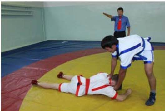
5 – сурет. «Бүк» белгісін көрсету әдісі