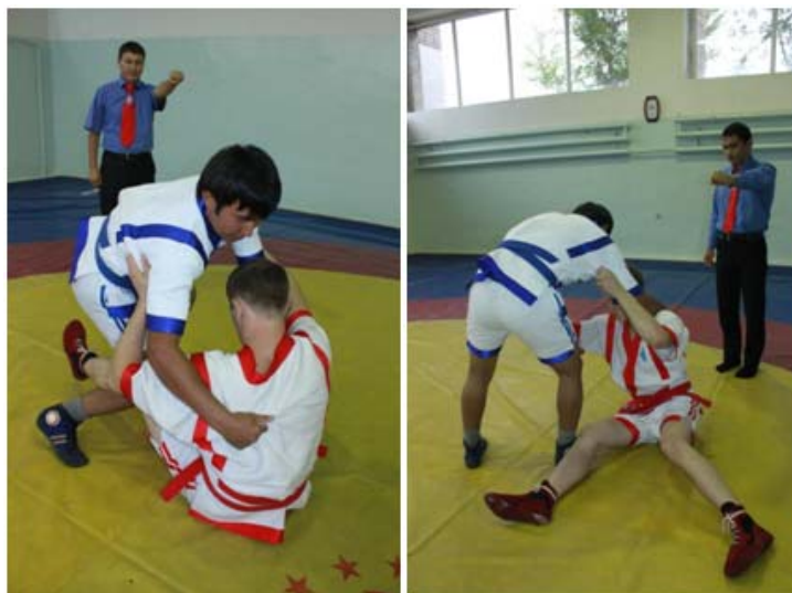
7 – сурет. «Жамбас» белгісін көрсету әдісі

Екі ескерту жасаған жағдайда «Жамбас» ұпайы беріледі.