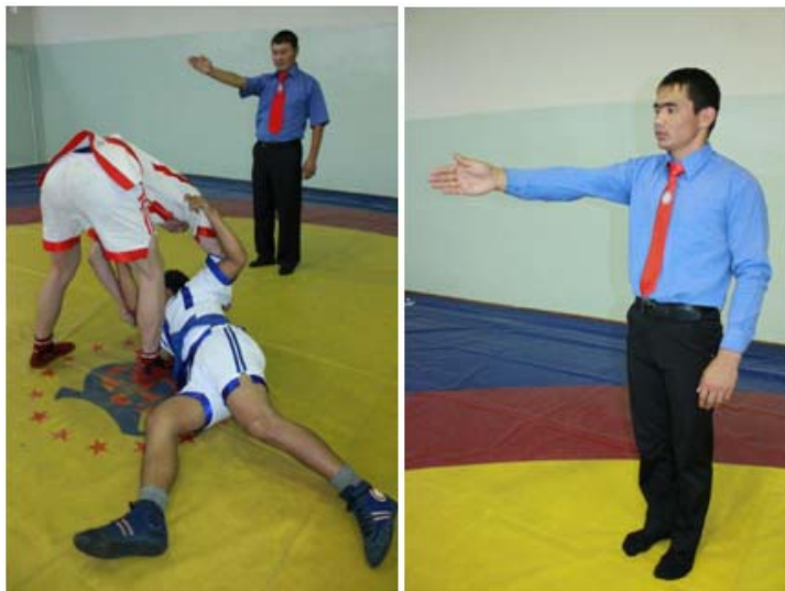
8 – сурет. «Жартылай жеңіс» белгісін көрсету әдісі

Б) «Жартылай жеңіс» - «көпірге тұру» және бір жауырынының және бір жақ қырының тиюі әсерінен болған әдіс тәсілдері.