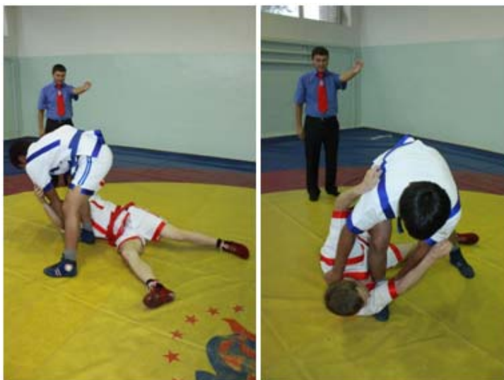
9 – сурет. «Жартылай жеңіс» белгісін көрсету әдісі

Оң не сол қолын иығының деңгейіне көтеріп, алақанының қырымен төмен көрсетеді. (8,9 – сурет)