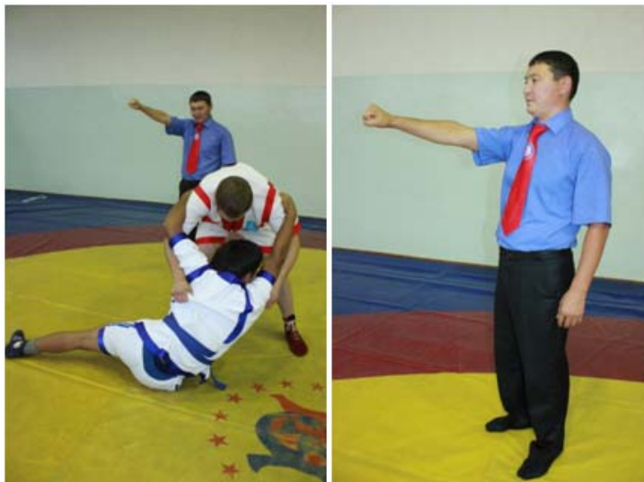
6 – сурет. "Жамбас" белгісін көрсету әдісі

Ә) "Жамбас"- бір немесе екі жамбасының тиюі әсерінен болған әдіс тәсілдері.