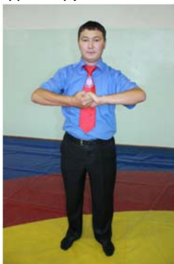
14 – сурет.

Мұндай жағдайда балуандар арнайы тағанға тұрып, бір-бірінің белбеуінен ұстайды. (14-15 суреттер)