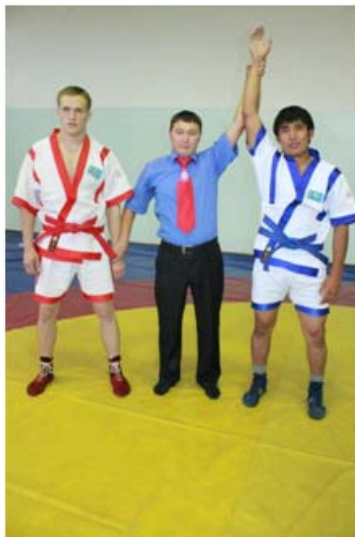
18 – сурет.

3) белдесу кезінде арқасы арқылы құлап немесе бір қырымен жата лақтыру әдісін сапалы жасаған балуанға беріледі.