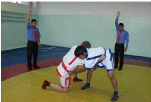
17 – сурет.