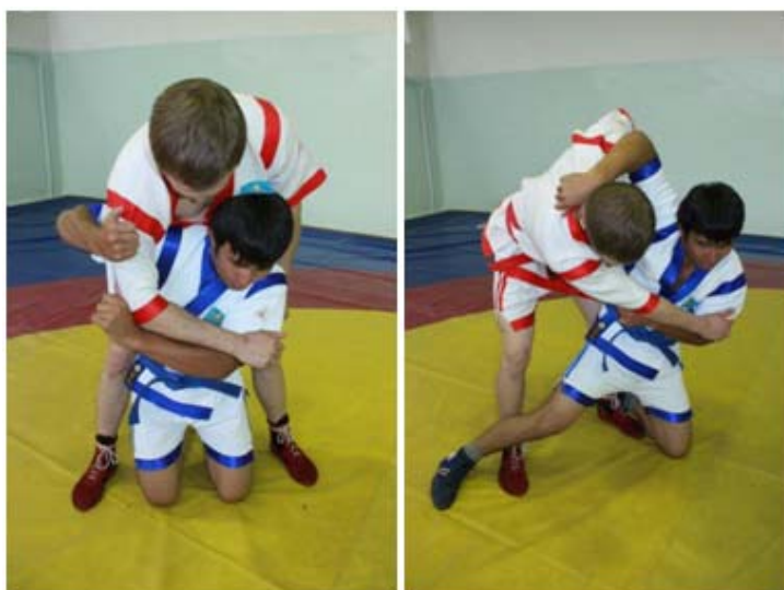
13 – сурет.

ә) «көпір» арқылы жасалған әдістер есепке алынады және бағаланады.