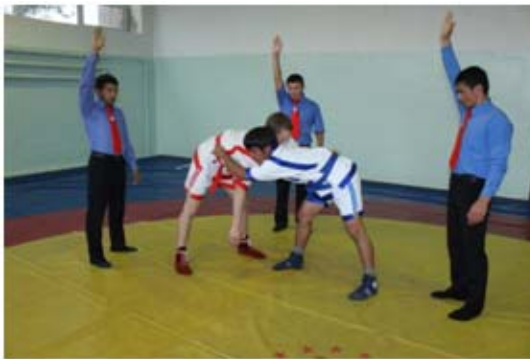
16 – сурет.