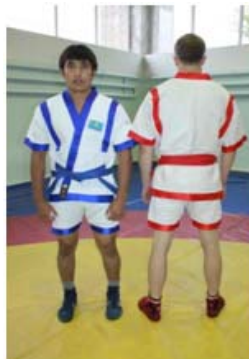
3 – сурет. Балуандардың киім үлгісі

Күртешеге арналған мата мықты және терді жақсы сіңіретін болуы қажет. Кеудеге киетін киім етегінің ұзындығы жамбасты толық жабуы және екі бүйірінде белдік өткізетін орны болуы тиіс. Жеңінің ұзындығы шынтақ буынына дейін жетуі тиіс. Белдіктің ұзындығы балуанның денесін екі орауға толық жетуі тиіс. Шалбардың балағының ұзындығы тізеге дейін болуы қажет. Кең тігілген шалбар белге бау арқылы ұстатылады. Кеудеше мен шалбардың түсі бірдей матадан тігіледі Аяқ киім қонышының ұзындығы тобықты жауып тұрады және ол жұмсақ былғарыдан тігіледі. (3 – сурет)