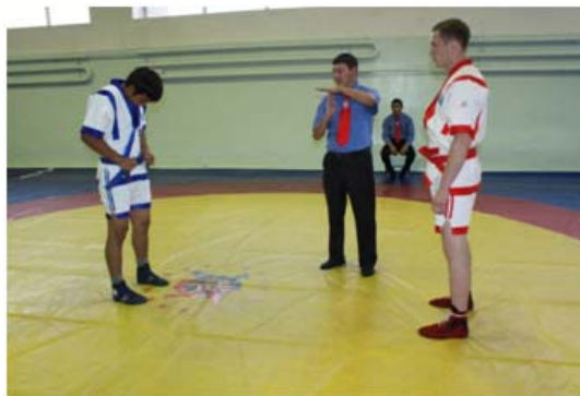
1 – сурет

Ереже бұзылса, "Тоқта!" деп дауыстап және алақанын жоғары көтеріп белгі береді. (1 - сурет)