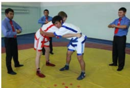
15 – сурет.