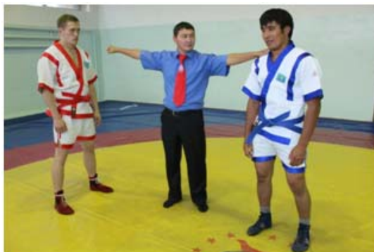
12 – сурет. «Ескерту» белгісін көрсету әдісі

Г) "Ескерту" сылбырлық танытқан жағдайда қолданатын белгі. Дауыстап "Ескерту" деп айтылады. Оң не сол қолын балуанның иығына тигізіп ескерту беріледі. (12 – сурет)