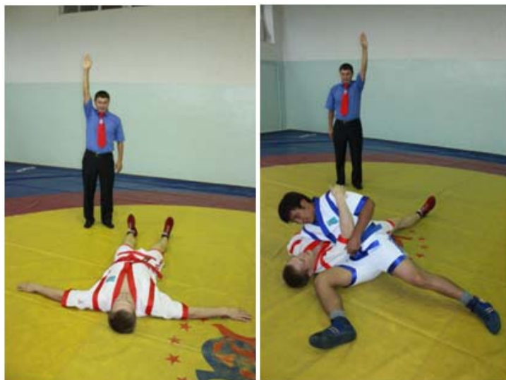
11 – сурет. «Таза жеңіс» белгісін көрсету әдісі

"Таза жеңіс" О балуан қарсыласының екі жауырынын кілемге тигізген жағдайда беріледі. Оң не сол қолын жоғары көтеріп, алақанын алдыға белгілеп ұстайды. (10,11 – сурет)